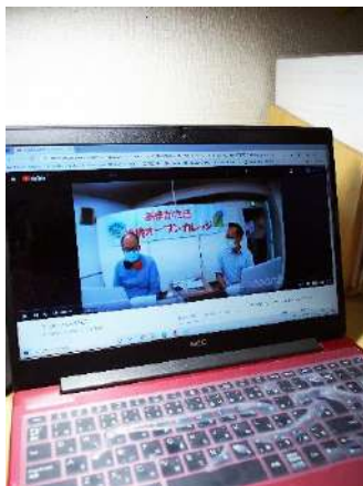
YouTube で動画公開中。 午後の部も視聴するのが楽しみ

同時に、「1日卵1個分のゴミを減らすことを意識してみよう(尼崎市一般廃棄物処理基本計画の市民1人あたりのごみ減量目標)」「牛乳パックを娘が通う中学校に持参しているが、チームプレイで成り立っているんだな」「日常で芽生える、小さな『こつ』だったら『こつ』したら『こつ』という思いや問題意識を大切にしよう」と自分ができること、していることの広がりなどを考える機会にもなりました。