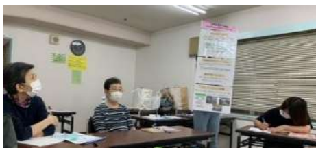
養成講座で多彩な活動の説明を受ける新しい仲間たち

数回の講座で初体験の後、11月初旬の「青空ランチ」で仲間入りです。さて、新しい協力隊の皆さん、どんな楽しみを探し当てるか。(キヨ)