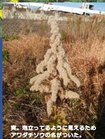
葉、泡立っているように見えるため アワダチソウの名がつけられた。