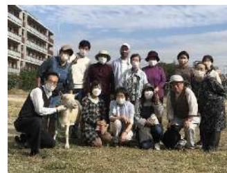
秋晴れの下、一堂集合!

広場ではこの日、別に多くの人たちが集まったグラウンドゴルフ大会があり、その内の数人でしたか、我らの野外パーティーを興味深そうに眺めていたのが、印象的でした。(まっちゃん)