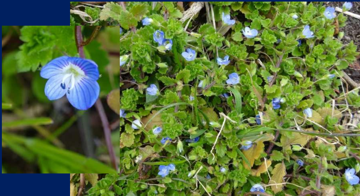
オオバコ科クワガタソウ属の越年草。花期 2月~5月 ヨーロッパ原産

TEL/FAX : 06-6421-0544 メール aoce@gb4.so-net.ne.jp