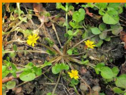
↑ コオニタビラコ(キク科)