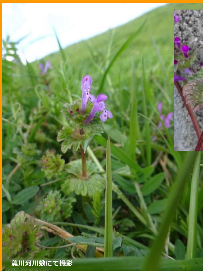
藻川河川敷にて撮影