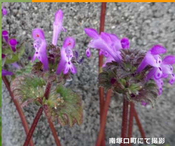
南塚口町にて撮影