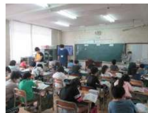
授業の様子【ごみ減量】

今後も、「あまがさき環境学習プログラム」を通して、一人ひとりの行動の輪を広げていきます。認定、おめでとうございます!