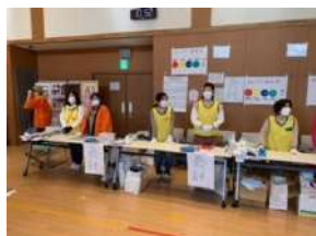
「ようこそ、カレンダー市へ」