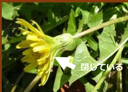
↑ 日本タンポポ (カンサイタンポポ)