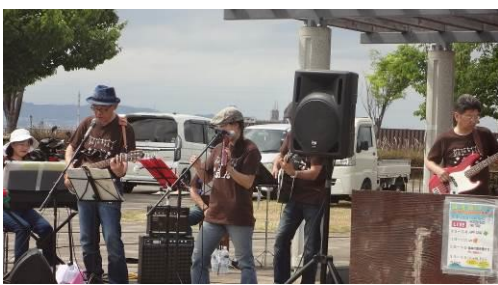
←今は音楽を楽しむのを中心にフェスタを行っています。たくさんの音楽仲間が集まり演奏し、楽しい時間を過ごしています。

子どもたちを集めて、島の成り立ちや島の中の様子などを絵にして、読み聞かせを始めました。大人が集まるだけでなく子どもたちにも楽しんで、島に興味を持ってもらうように！→