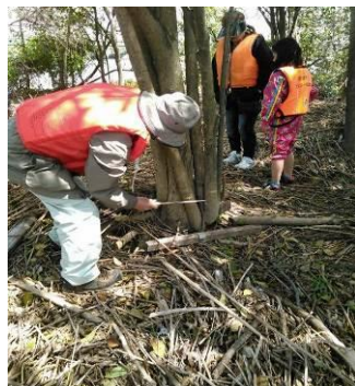
←外来種のトウネズミモチの駆除を行っています。外来種は繁殖力が強く、中々減りません。

子どもたちも島に上陸して、目で見て、種や苗を触ってみての学習をして貰っています。→