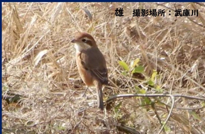
雄 撮影場所：武庫川