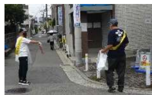
ポイ捨ては逃さず…立ち止まり 作戦を練る？

同タバコ店は、今秋間もなくお目見えする駅前16階建て新ビル1階で、リニューアル オープン予定。今は息子さん(40)の代ですが、市民の喫煙マナーの意識改革を目指し て意欲は十分。“最強メンバーの登場!”と他の仲間も気分上々。毎週木曜日(雨天と祝 日、8月は活動お休み)午前10時からの1時間が待ち遠しいね。(あさちゃん)