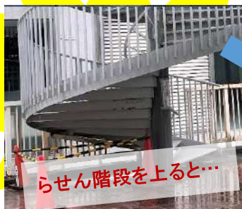
らせん階段を上ると...