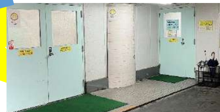
そこは...「あまがさき環境オープンカレッジ」(右側のドア)

2010年に「あまがさき環境オープンカレッジ」として開校。市と市民の協働事業として環境学習・啓発の場づくりを行っています。環境活動イベント「エコあまフェスタ」をはじめ、「あるもんで交歓会」「おもちゃ病院」「ごみレスキュー隊・トンクマン」など各種活動や講座を、年間を通じて展開しています。