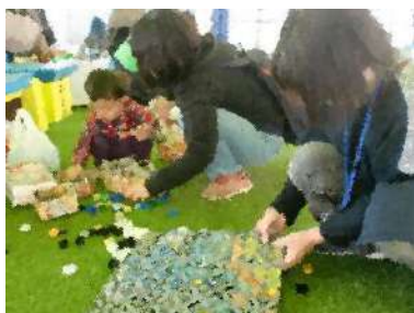
キャップ集めにチビッコも参加?

軽やかな行動力を誇るエコあま協力隊(男女17人)は今年も、個性豊かなブース出展を考えています。