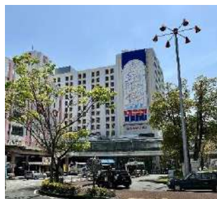
さんさんタウン 2番館 2階デッキへ...