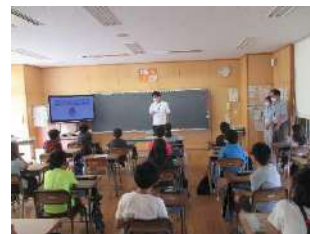
授業の様子【ごみ減量】

今後も、「あまがさき環境学習プログラム」を通して、一人ひとりの行動の輪を広げていきます。認定、おめでとうございます!