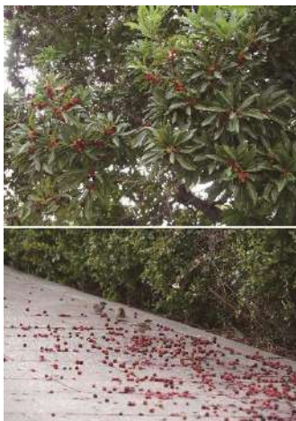
故郷・高知の県花と知り、より親近感が湧く

テレビ番組で「西日本豪雨から5年」という特集番組がありました。人間にとってもいろいろあったように、ヤマモモの木の中にもいろいろとあったのかもしれない。私の勝手な想像だけれど、思いを馳せずにはいられませんでした。