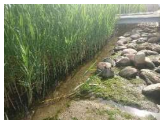
カニやチブなどの小動物やヨシが育つ干潟ゾーン