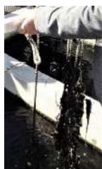
二枚貝(コウロエンカワヒバリガイ)の水槽

北堀運河のであい橋付近に設置されている水質浄化施設は、「生態系による自浄作用」を利用した水質浄化システムです。運河の水はこの施設を通過することで浄化され、再び運河へ戻る仕組みとなっています。