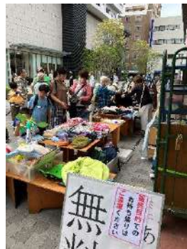
「お宝」はあったかな?

今月26日にも出店します。この「はんつか あるもんで」は立ち寄り自由の無料市です。場所柄もあり、持ち帰り中心の活動に絞りました。よろしくご協力をお願いします。展示品は衣料品や雑貨、漫画本などです。エコバック持参で来てくださいね。(キヨ)