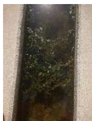
藻の繁茂する水路