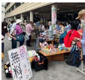
子どもは、おもちゃに夢中

この取組は、尼崎市の取組「使いたくなる はんつか駅前広場」を応援したい一、と2カ月に1回(偶数月・最終土曜日)開く楽しい活動です。電車の利用客や、買い物の行き帰りの人たちが興味を示してくれ、また、週末ですから親子連れも多かったようです。中には「あるもんで交歓会」や「オープンカレッジ広場」の顔なじみもいて、この取組の広がりを実感。思わず気分がハイに。