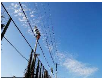
その時に撮影した写真

その場で5分間立ち止まって、ノートに書き出すことも試しました。言葉で書き出すとすると、どんな風景? 音は? 香りは? 感覚は? 私は何を感じた? と自問自答が始まり、より季節を感じられるようになった気がします。