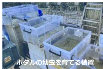
ホタルの幼虫を育てる装置

「むこっ子ロード整備実行委員会」の皆さんが武庫小の一角にホタルを育てる施設「ピカリンガーデン」を建て、武庫小3年生の環境学習と「むこっ子ロード・キッズクラブ」の皆さんたちとともにホタルの育成や環境整備活動をされています。