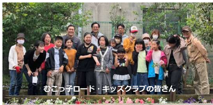
むこっ子ロード・キッズクラブの皆さん