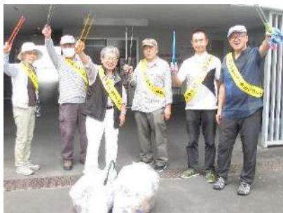
黄色のタスキが目立ってます

同駅南側の住宅街で、シニアのご婦人らから「いつも、ご苦労さま」の声掛けを受け、気分よく作業できましたが、成果少々で恐縮するしだいでした。