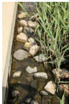
人工干潟の葦(ヨシ)が水中の栄養分を吸収