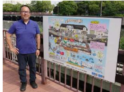
小学生にもわかりやすいようにイラストを使った案内板。