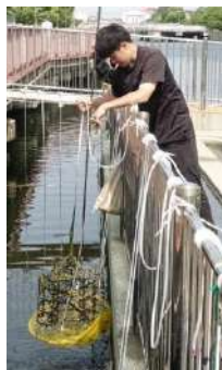
小魚の住みかを手作りして調査