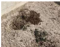
藻や貝殻をたい肥に