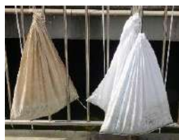
藻を採取して天日干し