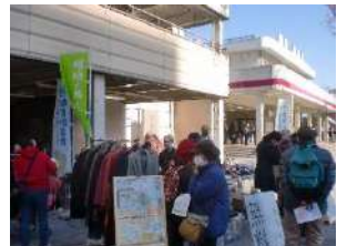
駅南口からのお客も

さっそくエコあま協力隊は、師走の10日昼前の2時間、同広場の一角で「ミニあるもんで交歓会」を開いて、行き交う皆さんに“不用品持ち寄り無料交換の妙”をアピールしました。