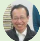
実行委員長 ピロー

2023年度も、コロナとうまくつきあいながら積極的に世代を超えて事業を進めていきたいと考えています。