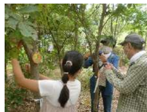
できた名札を、 ハイ！木につけました