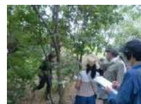
しっかり観察！ 葉っぱの木探し