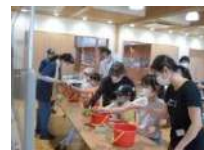
まず好みの葉っぱ選び