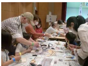
竹細工と蝶の鱗粉転写(後方)に夢中