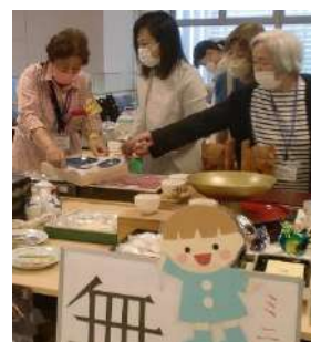
「無料」の看板がお客を呼んだ?

洋服・エプロン・皿・装飾品・玩具など、お宝の品々を持ち帰ってもらい、会の目的を広くアピールできました。アリガトウゴザイマシタ。(キヨ)