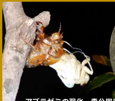
アブラゼミの羽化 森公園にて