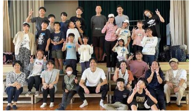
多世代のまちの人と交流します