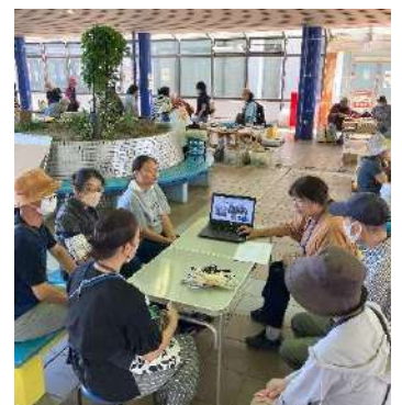
活動現場のひとつ「オープンカレッジ広場」でも説明会