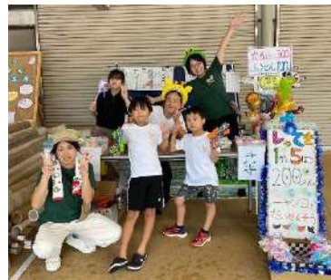
お店体験(園田カーニバル)