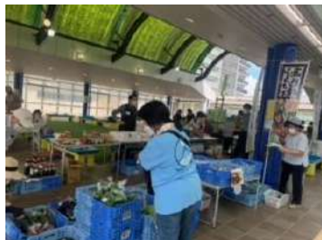
酷暑とあって担当者ばかりが目立つ

なお、エコ工作やアロマオイルを使った入浴剤作り、また音楽ボランティア2組の応援団の活動もありました。(のりちゃん、キヨ)