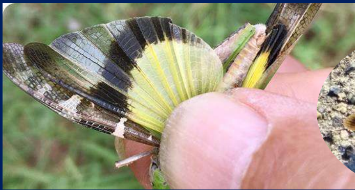
クルマバツタ (藻川) ↓