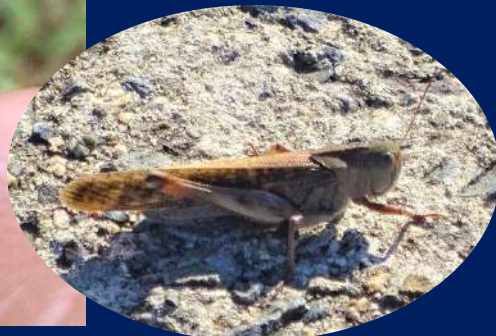
← クルマバツタモドキ (尼崎の森中央緑地)