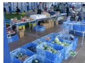
ズリリ並んだ新鮮野菜