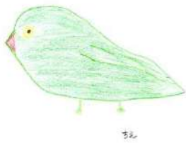
鮮やかなグリーン色のワカケホンセイインコ

調べてみたら、50年ほど前にペットブームでもたらされた「ワカケホンセイインコ」が野生化して、都心で増えているというニュースを発見! スズメ、ハト、カラス、インコのいる風景が当たり前になるかもしれない…なんている? そんなことが、鳥のことに限らず、いろんな面で起きているんだ、これまでも起きてきたんだと改めて意識しました。