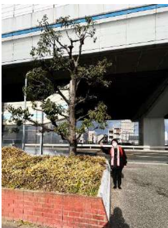
新年と一緒に写真を撮りました

「おもちゃの木」交流日記、更新中 https://loopdrawingtree.blogspot.com/