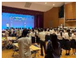
エコあまフェスタ (中央北 2023.6.10)

●エコあまフェスタ、打ち水大作戦などの実施拠点として、市民の皆さんに環境活動の大切さを楽しく伝えていきます。(ポブ)