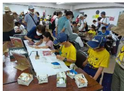
大人も子どもも作品づくりに夢中…

「我が子がこんなに集中して取り組む姿を初めてみました」と、目を細める親御さん。一方で「作品制作中に、おいちゃん上手だね、と言葉をかけてくれて、うれしかった」の声も聞きましたよ。私たち大人は、子どもたちから元気をもらって、生かされているってことかな。(とも、キヨ)