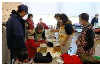
ご存じ?あるもんで交歓会