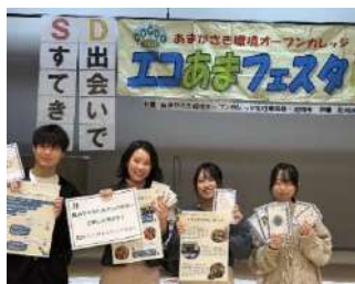
エコあまフェスタ 2024