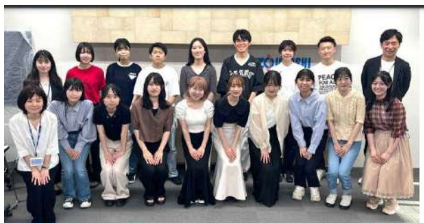
関大マイボトルアンバサダー&象印マホービン(株)の社員の皆さん