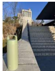
キャンパスに ‘映える’ マイボトル

●昨年12月に開催された「エコあまフェスタ」に出展してくれた「関大マイボトルアンバサダー」のメンバーに会いに関西大学の千里山キャンパスを訪ねました。