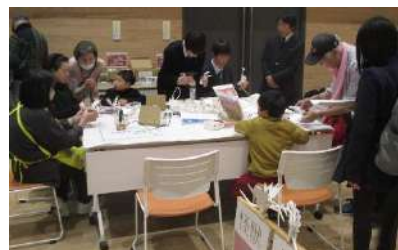
怪獣しくりに夢中

エコあま協力隊は、今回も個性豊かな出展です。3階ブースでは「チームあるもんで」が出張版の「あるもんで交歓会」を出店し、衣服、陶器類などの品々をそろえ、お宝を持ち帰ってもらう活動の存在と目的をPRしました。中には体型ぴったりのコートを見つけ、大喜びする女性の姿もありましたよ。さらに、家庭で不要になった紙皿やダンボール類で「怪獣をつくるエコ工作」コーナーで