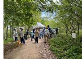
みんなでぞだてるぼうけんの森