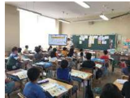
環境教育プログラム