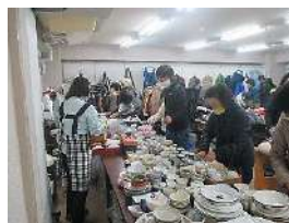
あるもんで交歓会