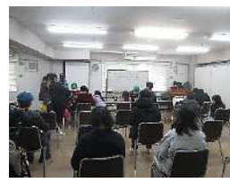
おもちゃ病院塚口診療所