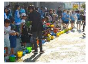
打ち水大作戦 in あまがさき