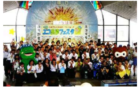
エコあまフェスタ