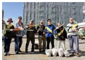
ごみレスキュー隊トングマン